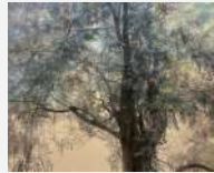
参考作品 「化粧する者」2022年

現在 金沢美術工芸大学大学院 美術工芸研究科 美術領域 日本画分野 博士在学 2023年 金沢美術工芸大学大学院 美術工芸研究科 絵画領域 日本画コース 修了 1997年 福岡県生まれ 2023年 「新緑の頃の絵画展」(ギャラリートネリコ/金沢) 2023年 KANABIクリエイティブ賞2022 卒業・修了制作部門 学長賞 2022年 「金美選抜展 in 問屋町」(金沢流通会館) 2022年 第9回改組新日展 入選 2021年 「ふたり展」(金沢 cafe&gallery musee) 2021年 「耀画廊選抜展 一対の世界」(東京九段耀画廊/東京) 2021年 第8回改組新日展 入選 2020年 第7回改組新日展 入選