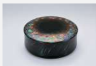
参考作品 「乾漆螺細箱(カタバミ)」2023年

現在 金沢美術工芸大学大学院 美術工芸研究科 工芸領域 漆芸分野 博士在学 2022年 秋田公立美術大学大学院 複合芸術研究科 修了 1996年 中国安徽省生まれ 2023年 薪技芸 国際青年工芸展(吉林芸術学院美術館/長春) 2023年 国際漆展・石川2023 入選 2023年 第63回石川の伝統工芸展 入選 2023年 第15回秋田工芸展 県議会議長賞 2023年 薪技芸 国際青年工芸展 銅賞 2022年 第62回東日本伝統工芸展 入選 2022年 第14回秋田工芸展 秋田県知事賞