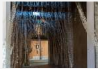
参考作品 「Inner」2023年 GO FOR KOGEI 2023

現在 金沢美術工芸大学大学院 美術工芸研究科 美術領域 彫刻分野 博士在学 2023年 金沢美術工芸大学大学院 美術工芸研究科 工芸専攻 染織コース 修了 1993年 内モンゴル生まれ 2023年 「記憶をほどく、編みなおす」企画展(ギャラリー無量/砺波) 2023年 「GO FOR KOGEI 2023」(岩瀬エリア・沙石/富山) 2023年 「金沢彫刻祭2023」(第一ビル/金沢) 2023年 KANABIクリエイティブ賞2022 卒業・修了制作部門 招聘審査員特別賞 2022年 「工芸2022」(雪梁舎美術館/新潟) 2022年 「輪廻」—033・YULING LIN二人展(アートベース石引/金沢) 2022年 「つながる糸 ひろがる布」(堀川御池ギャラリー/京都) 2022年 「染展」(BE=Lab&Gallery/大阪)