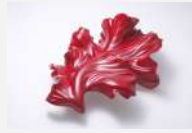
参考作品 「変容するかたち」2023年

現在 金沢美術工芸大学大学院 美術工芸研究科 工芸領域 漆芸分野 博士在学 2023年 金沢美術工芸大学大学院 美術工芸研究科 工芸専攻 漆・木工コース 修了 1996年 中国福建省生まれ 2023年 国際漆展・石川2023 入選 2023年 日本漆工協会 漆工奨学賞 2023年 第79回金沢工芸展 北国新聞社長賞 2023年 KANABIクリエイティブ賞2022 卒業・修了制作部門 学長賞 2022年 第5回金沢・世界工芸ビエンナーレ 入選 2022年 KANABIクリエイティブ賞2021 制作部門 奨励賞 2022年 「かたちをまとう」三人展(中村記念美術館/金沢) 2021年 「工芸2021」(新潟雪梁舎美術館/新潟) 育成賞